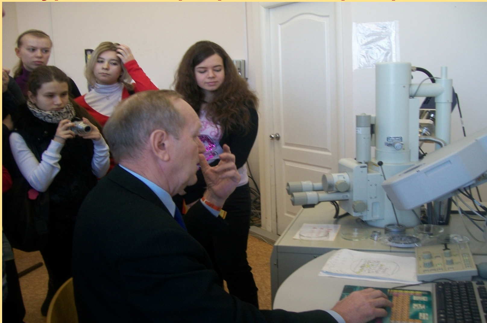
Экскурсия в лабораторию электронной микроскопии